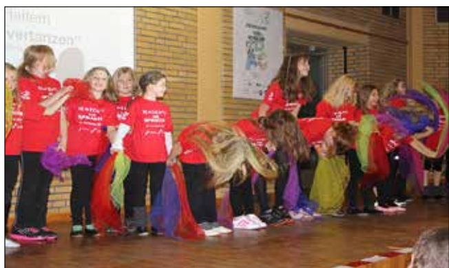
ATV Haltern Kindertanzgruppe

Die Fachtagung BEWEGUNG trifft SPRACHE – 30. Nov. 2013, Datteln – war ein weiterer Meilenstein auf dem Wege zur Umsetzung des Bildungsprofils der Sportjugend im Kreissportbund Recklinghausen e.V. Auf der Basis der bestehenden konzeptionellen und organisatorischen Vorarbeiten, die nicht nur kreis- und landesweit, sondern auch bundesweit viel Beachtung gefunden haben, ist im Verlauf dieser Fachtagung aufgezeigt worden, wie Bewegung, Spiel und Sport – hierbei vor allem auch der organisierte Kinder- und Jugendsport – die Erziehungs- und Bildungsprozesse im Kindesalter konkret und ganz praktisch unterstützen kann. Bei der